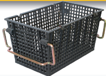
PANIER 300 / 8x8

L : 410 / l : 245 / h : 132 H sur anses pour Gerbage : 125 mm Maillage : 2X2 mm