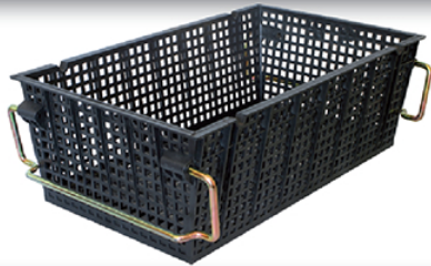
PANIER 410 / 8x8

L : 410 / l : 245 / h : 140 H sur anses pour Gerbage : 125 mm Maillage : 8x8 mm