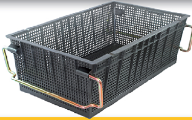
PANIER 410 / 4x4

L : 410 / l : 245 / h : 140 H sur anses pour Gerbage : 125 mm Maillage : 8x8 mm